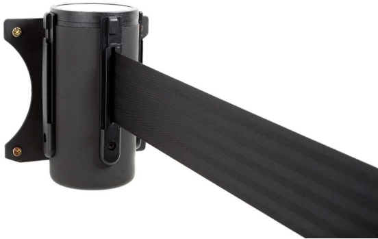
Abb. 1: ALW-10-3,0-0030