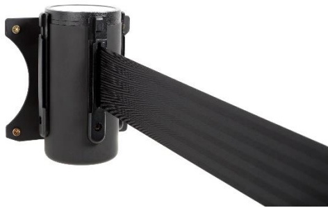
Abb. 1: ALW-10-0030