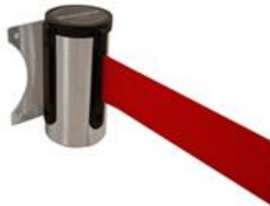
Abb. 2: ALW-200-0010

Variabel oder stationär einsetzbares Absperromodul mit ausziehbarem und selbstaufrollendem Gurtband zur Leitung von Personenströmen oder zur temporären Abspernung bestimmter Bereich.